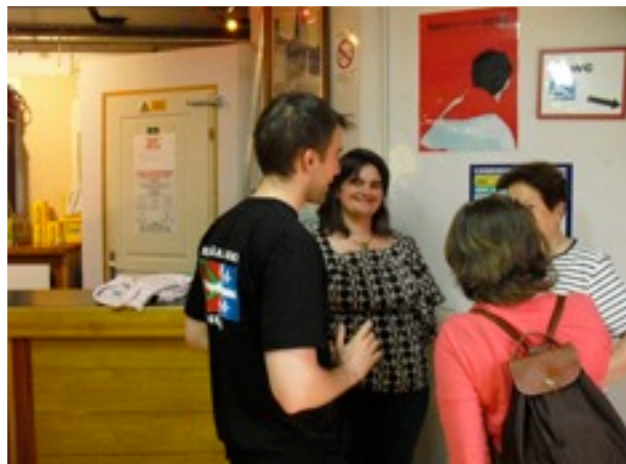
Et à des membres de l'Euskal Etxe de Paris...