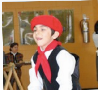
COURS DE DANSE