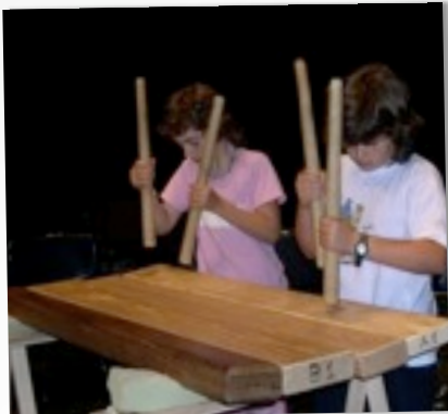
COURS DE TXALAPARTA