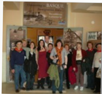
VOYAGE DE GROUPE