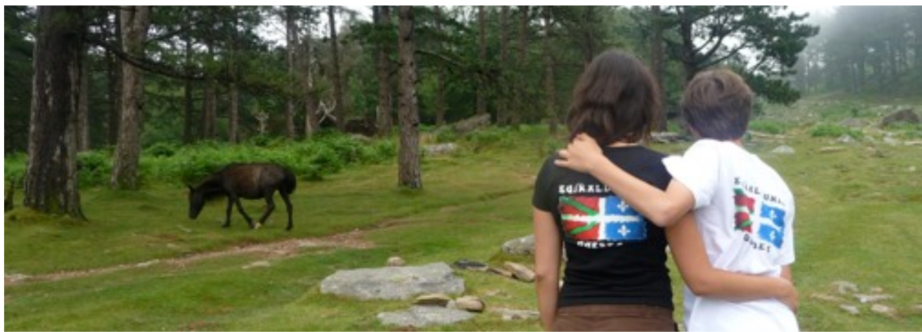
Il s'est aussi promené en Euskal Herri...