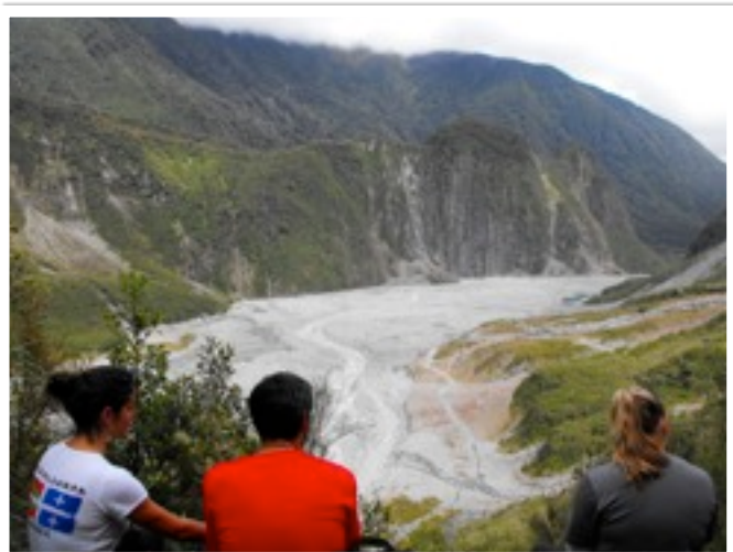
Et il a même visité le Glacier Fox, en Nouvelle- Zélande...

Envoyez-nous vos photos avec le tee shirt Euskaldunak Québec ! Pour en acheter un, contactez-nous : euskaldunakquebec@yahoo.ca