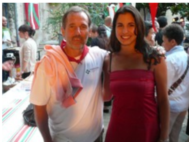
Il a été offert au président de l'Association des basques de Bordeaux...