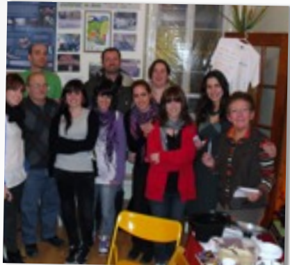
COURS DE BASQUE